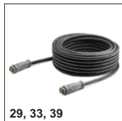
29, 33, 39